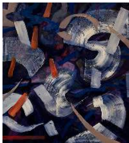
Max Maus, I don't even know what your favorite flower is , 2024, Öl auf Leinwand, 155 x 145 cm