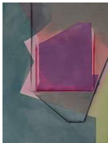
Clara Magdalena Brückmann, A Place I Almost Stayed , 2024, Sprühfarbe & Acryl auf Leinwand, 190 x 146 cm

INES SCHULZ · CONTEMPORARY ART UND IM KOSMOS CAFÉ OBERGRABEN 10 · 01097 DRESDEN